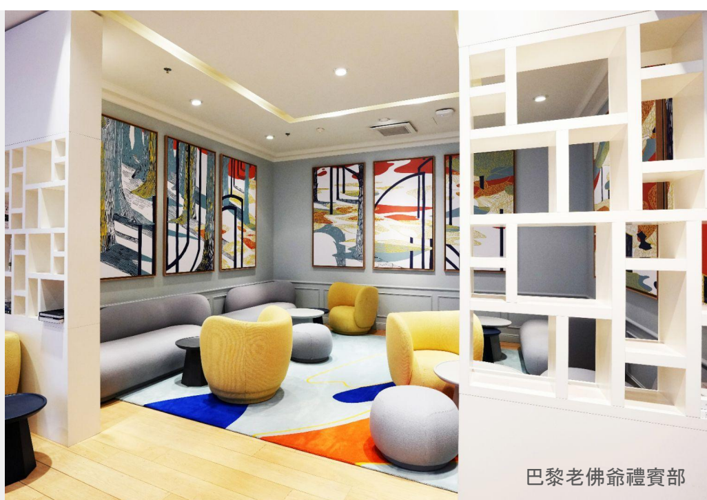
巴黎老佛爺禮賓部

Accédez au Lounge "Le Concierge" (2) avec rafraîchissement et profitez du remboursement rapide de 12% de la TVA (3)