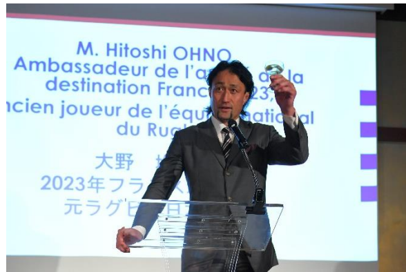
Hitoshi Ohno a présidé le toast de la réception du workshop de l'industrie du tourisme français SAKIDORI FRANCE, organisé juste après sa nomination.

Site de l'Ambassadeur de l'Amité pour la Destination France 2023 : www.france.fr/ja/aa2023