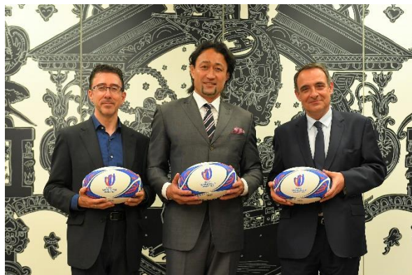
(左) フレデリック・マゼンク フランス観光開発機構在日代表、(中央) 大野均氏、(右) フィリップ・セトン駐日フランス大使

2023年5月31日にフランス大使館で行われた任命式では、フィリップ・セトン駐日フランス大使、カロリーヌ・ルブシェ フランス観光開発機構総裁が署名する任命状が、セトン大使より大野氏へ手渡されました。