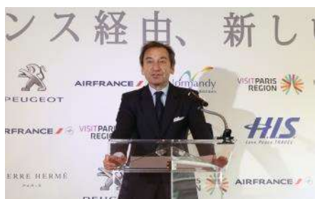
ティエリー・ダナ駐日フランス大使より開会のご挨拶

記者発表会内では、当キャンペーンの主要パートナーであるエールフランス航空を代表し、ステファン・ヴァノヴェルメール エールフランス航空/KLM オランダ航空日本・韓国・ニューカレドニア支社長が当社のサービスについて紹介。東京・大阪路線のすべてのフライトに最新の客室機材を導入するなど日本市場の重要性、ギー・マルタンやジャン・シュルピスらトップシェフを起用したビジネスおよびファーストクラスの機内食、夜便ネーミングキャンペーンに4万を超える応募から大賞作《翌朝、逢え→るフランス》に決定したことを発表しました。