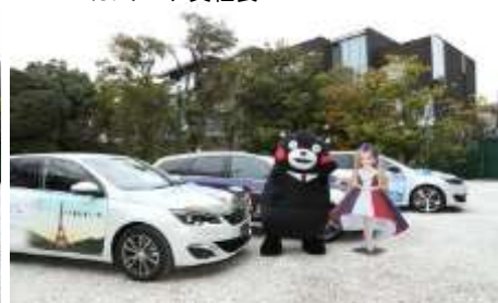
フランスキャラバンのラッピングカーをアピールするくまモンとリカちゃん

フランス観光開発機構は 2017 年度フランス観光キャンペーンパートナーのご参加に感謝申し上げます。