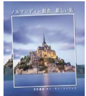
キャンペーンビジュアル(ノルマンディー、モン・サン・ミッシェル)

キャンペーンパートナーでフランス自動車メーカー プジョー提供の Peugeot 308 上にキャンペーンビジュアルを施したラッピングカーが都内を走行。2017年3月20日(月)~4月2日(日)。 走行中のキャラバンを写真に撮り、ハッシュタグ #フランスキャラバン を付けて Twitter か Instagram へ投稿した人の中から、抽選でフランスに関連する商品が当たるキャンペーンを実施します。実施日 3月20日~4月2日(9:00~19:00)